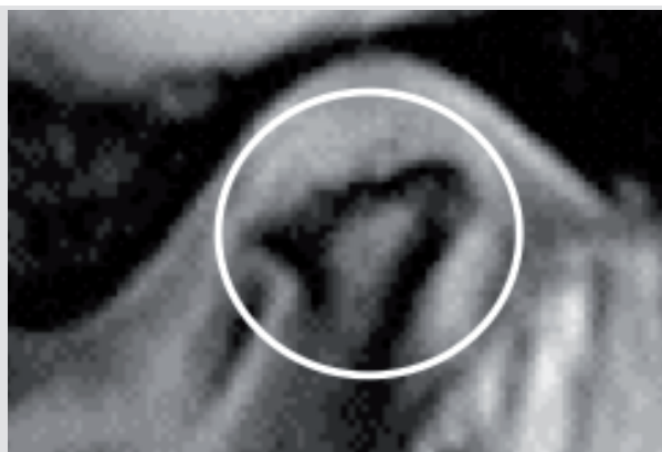
Abb. 2: Formverändertes Gelenkköpfchen